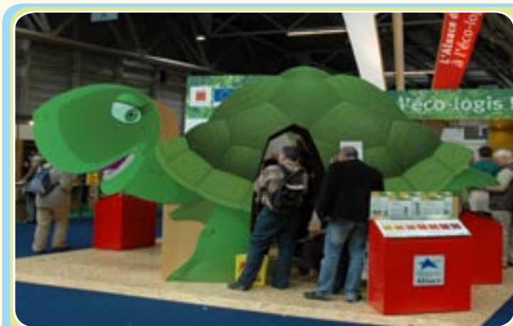
Energivie: encourage le recours aux énergies renouvelables

Fin 2007, l'Alsace comptait 143 chaufferies bois collectives, près de 20 000 m 2 d'installations solaires collectives et près de 45 000 m 2 de chauffe-eau solaires individuels. En clair, il s'agit d'une multiplication par 5 des équipements entre 2003 et 2007. Ce projet va continuer de bénéficier du soutien de l'Union européenne entre 2007 et 2013. Il a été récompensé dans le cadre des «REGIOSTARS 2008», les prix décernés par la Commission européenne aux projets régionaux les plus innovants d'Europe.